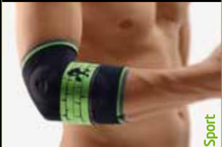
BORT EpiBasic Sport Art. Nr. 122 600 Sport